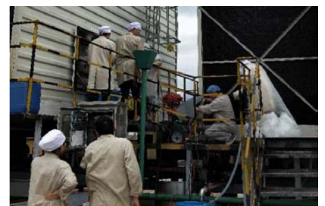
（七甸提取 OU 余红胜）